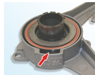
Kuva 3: Oikein

Hydraulisen painelaakerin asennuksessa on varmistettava, että laakerin (1) tasainen pinta on kytkimen suuntaan!