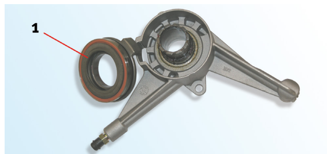
Kuva 1: 510 0016 10